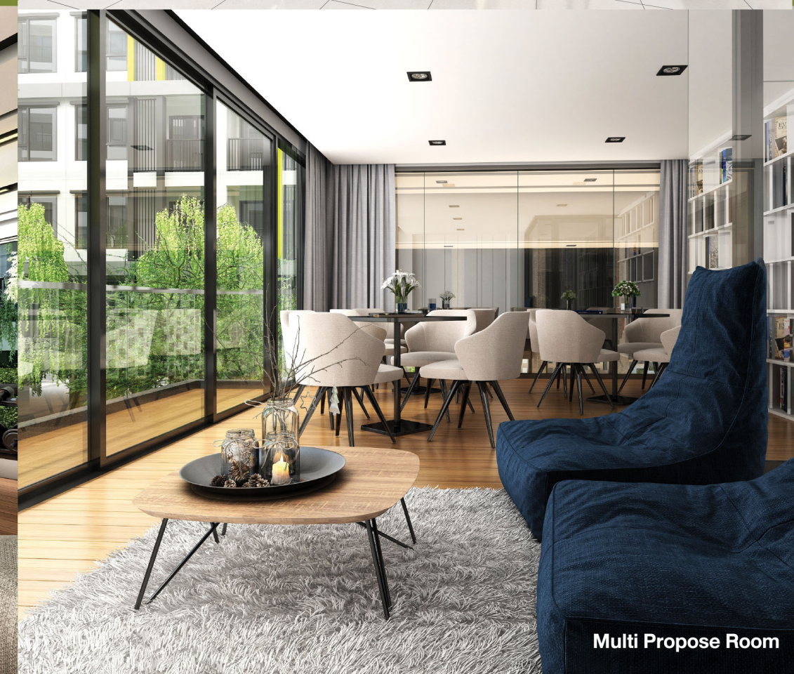
Multi Propose Room