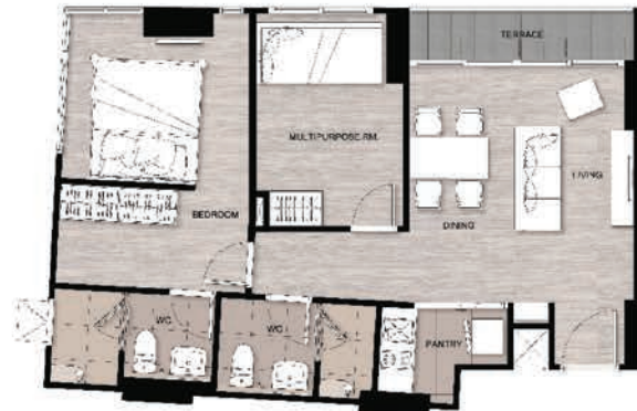
F 2BEDS 2BATHS 60 SQ.M.