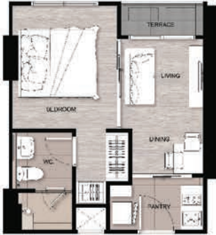
A 1BED 30 SQ.M.