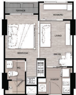
C 1BED 34.9 SQ.M.