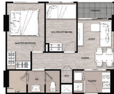
E 2BEDS 1BATH 49.5 SQ.M.