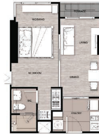
D 1BED 40 SQ.M.