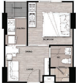
B 1BED 30 SQ.M.