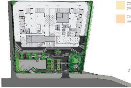
1 st FLOOR PLAN