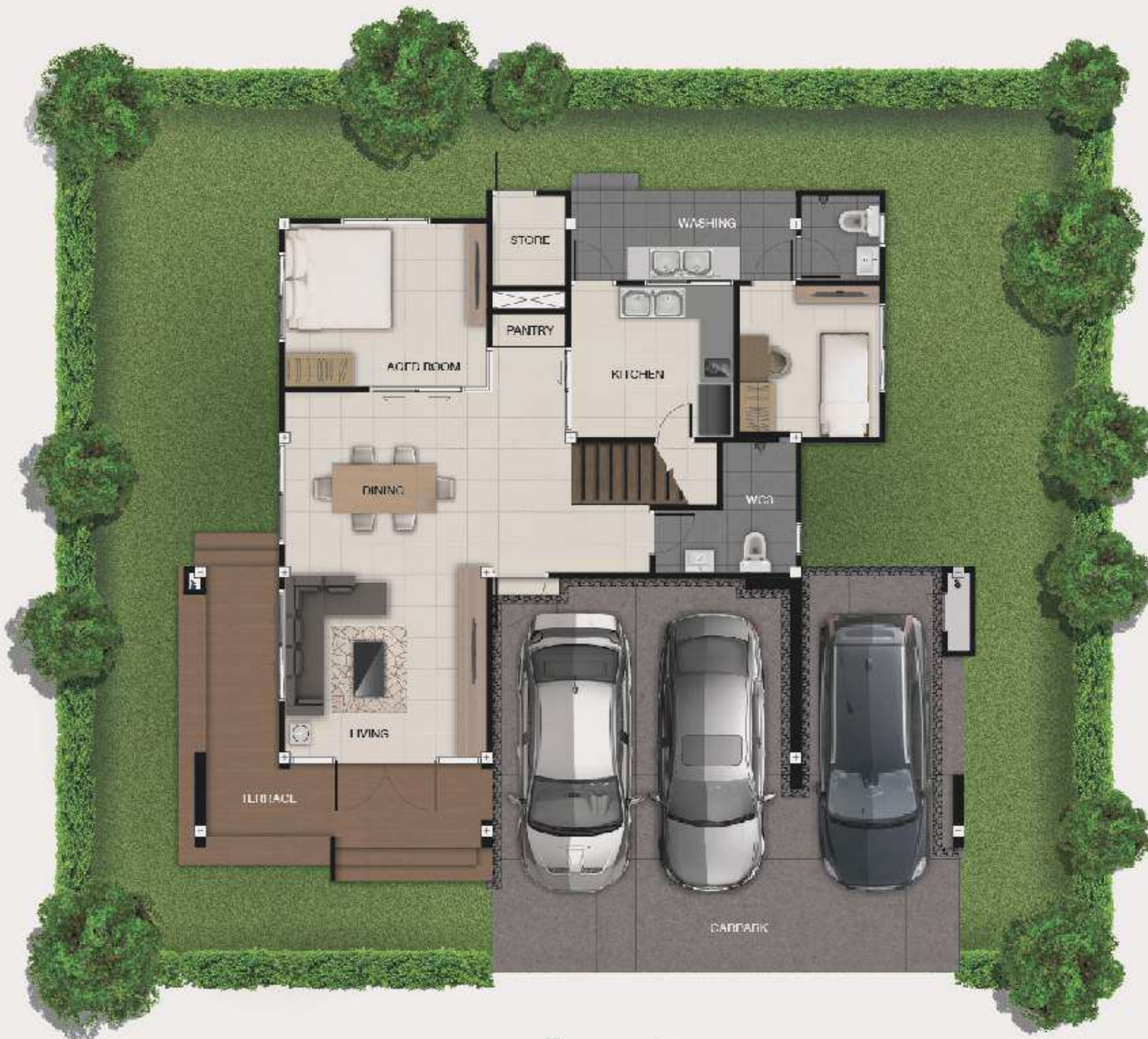
แบบบ้านอาทิตย์ 1 ST FLOOR