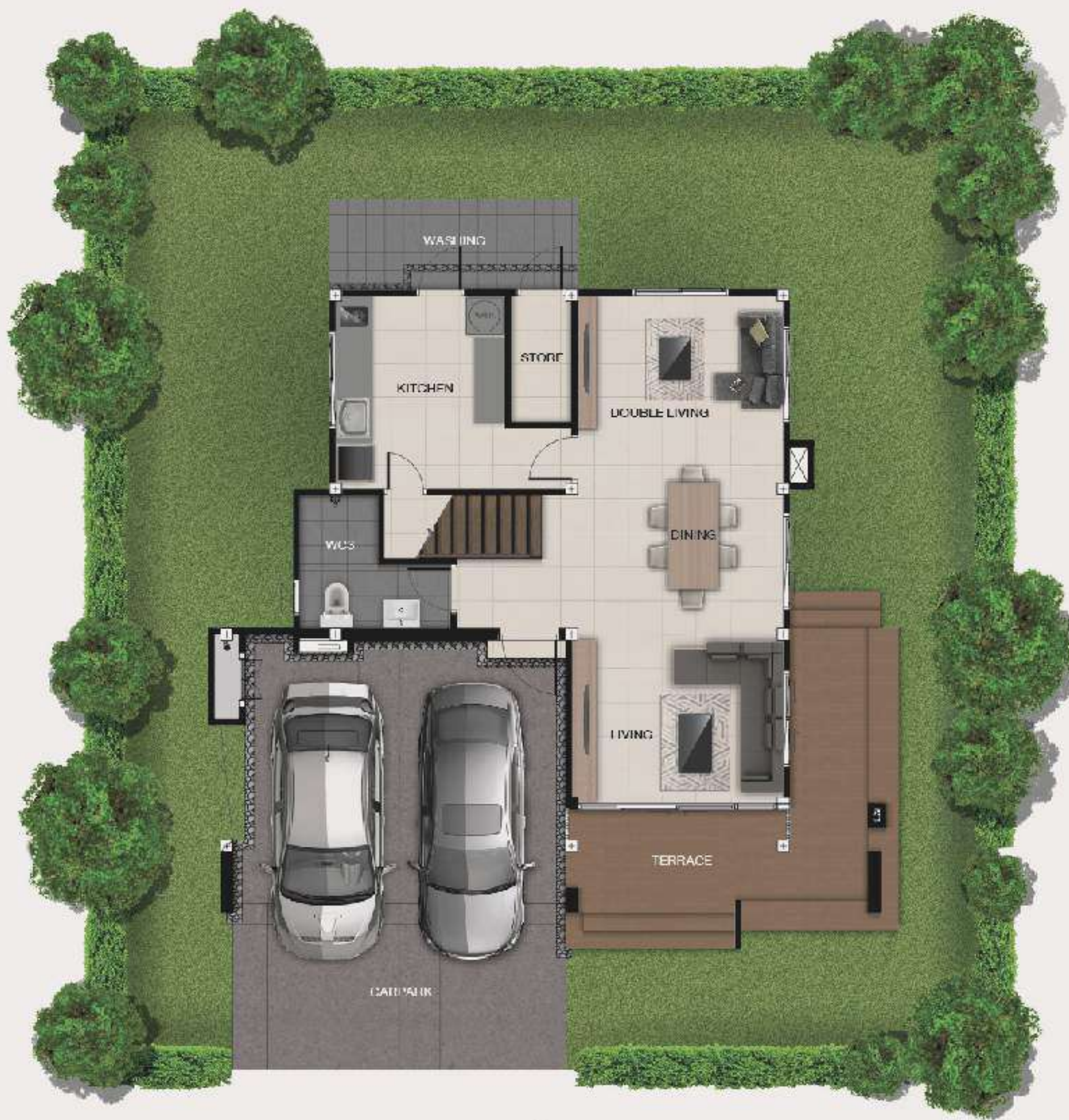
แบบบ้านอรุณ 1 ST FLOOR