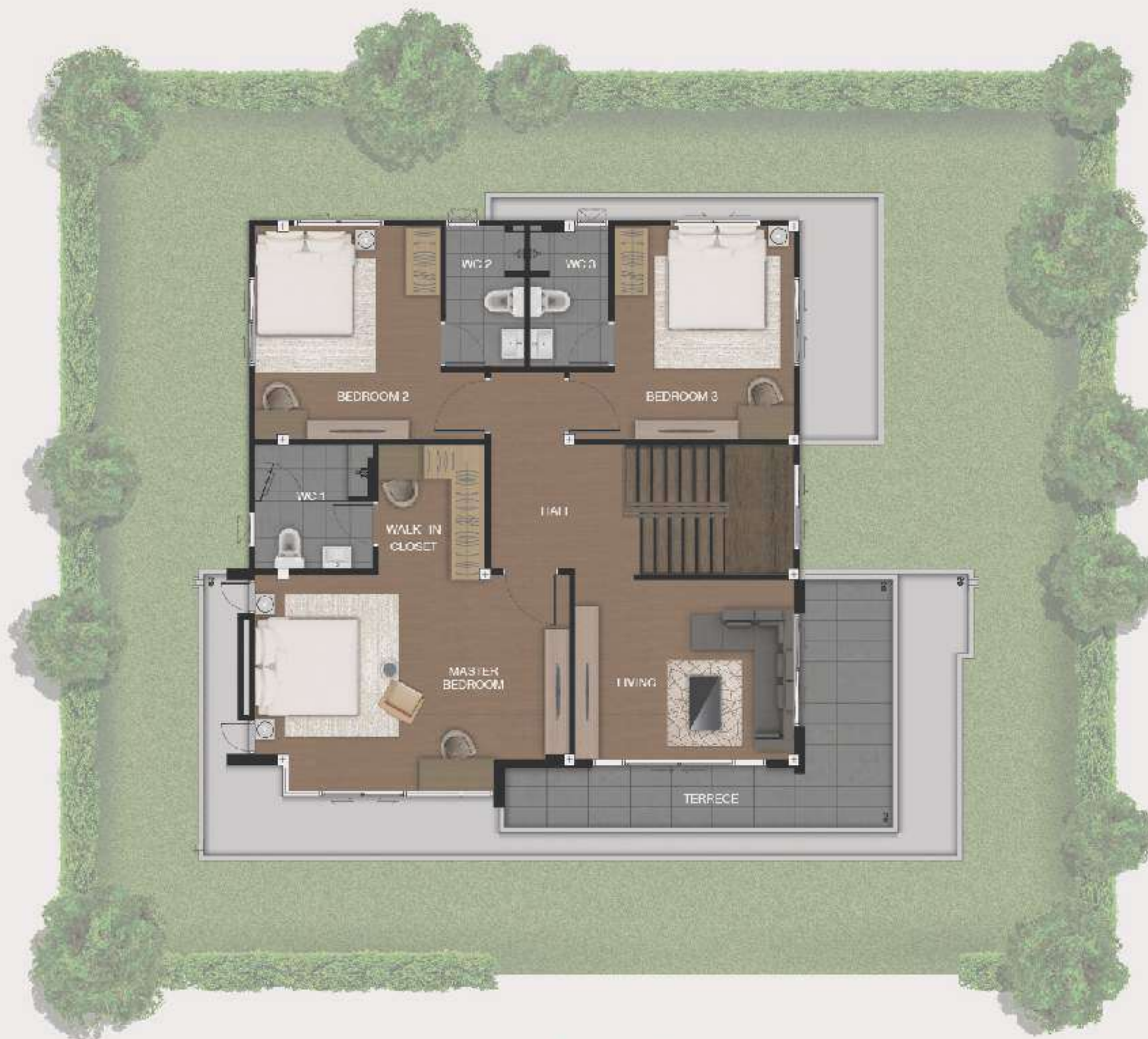
แบบบ้านอาทิตย์ 2 ND FLOOR