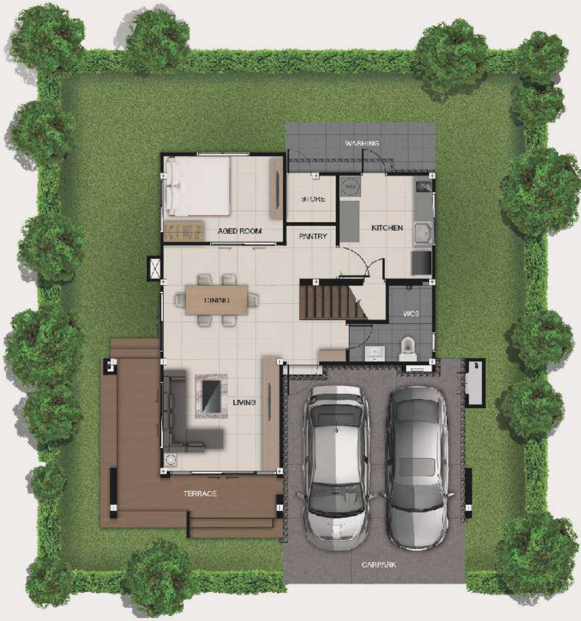
แบบบ้านสาวิตา 1 ST FLOOR