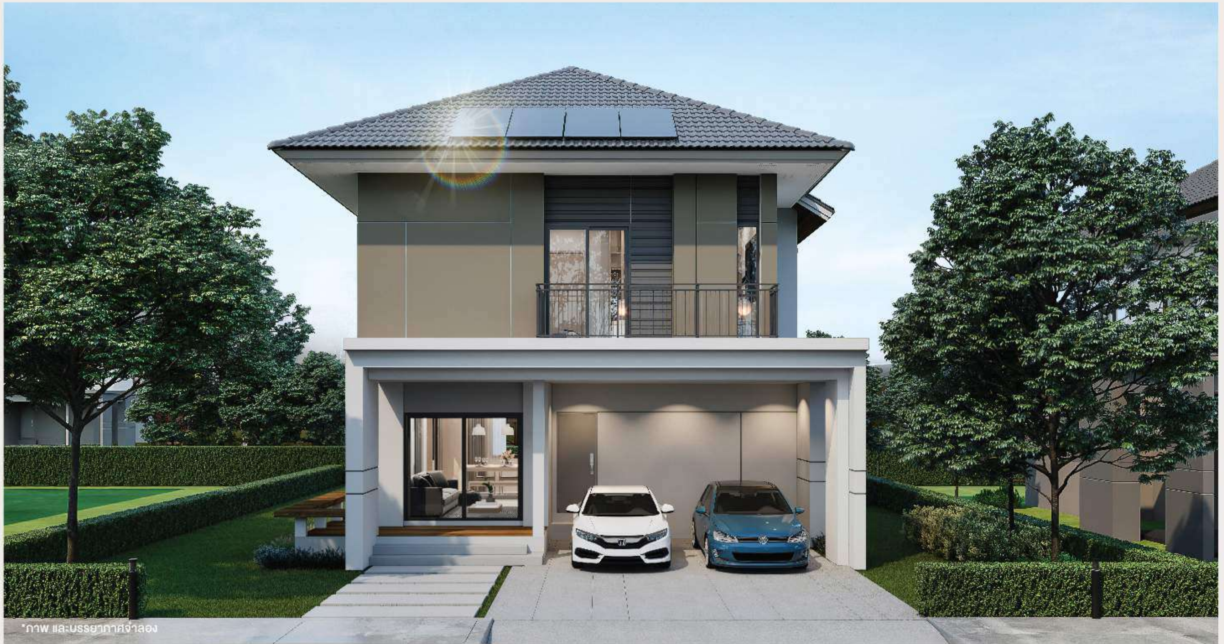
*ภาพ และบรรยากาศจำลอง