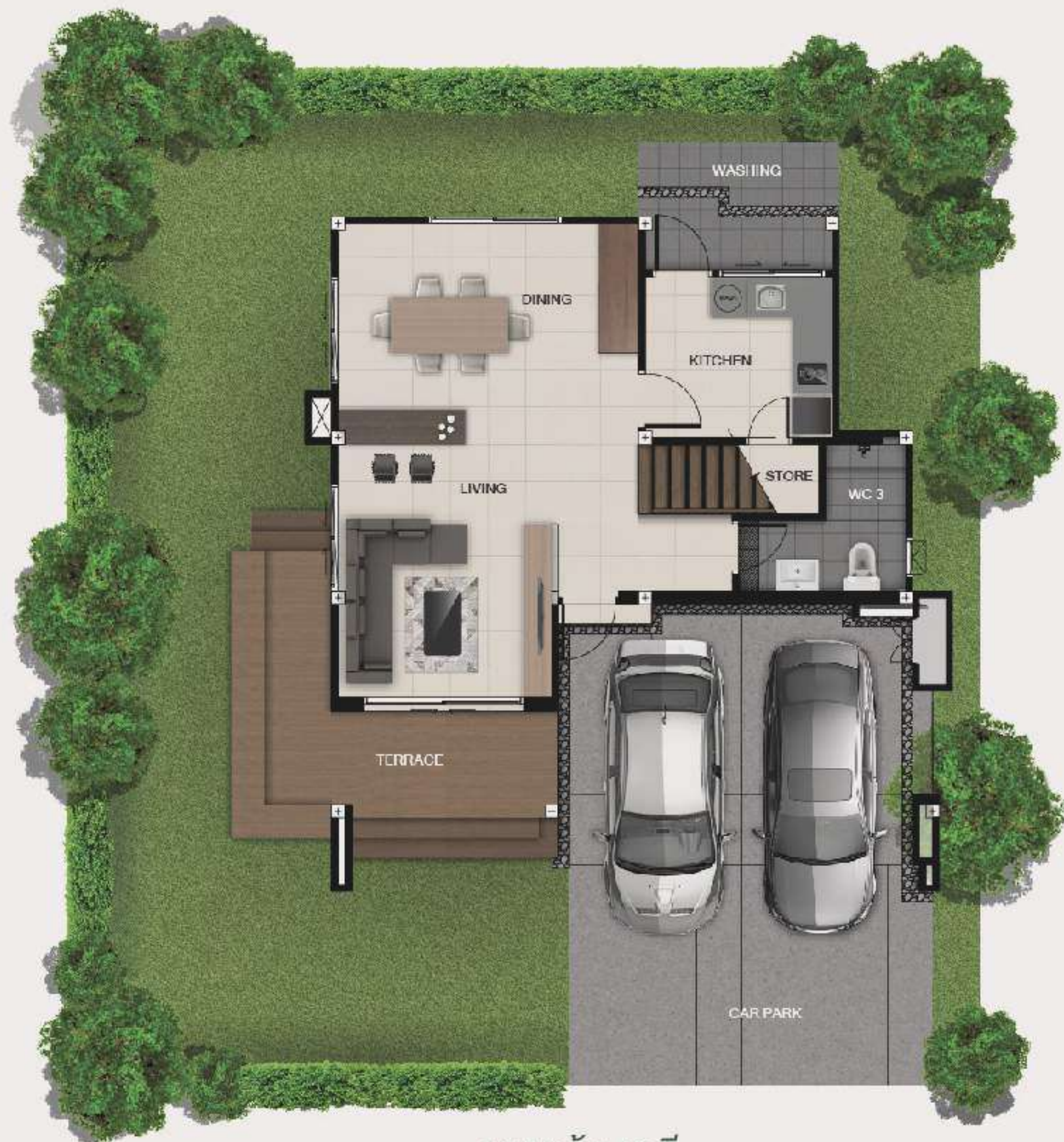
แบบบ้านรวี 1 ST FLOOR