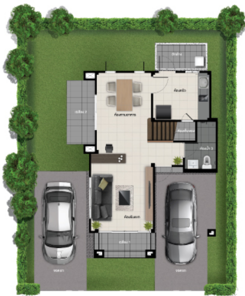
ชั้นล่าง

พื้นที่ใช้สอย 151 ตร.ม. 3 ห้องนอน 3 ห้องน้ำ 2 ที่จอดรถ