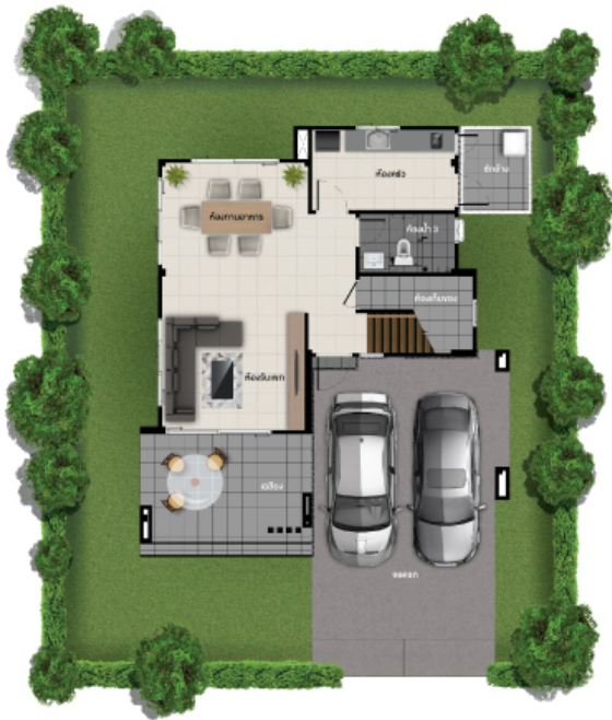
ชั้นล่าง

พื้นที่ใช้สอย 190 ตร.ม. 3 ห้องนอน 3 ห้องน้ำ 2 ที่จอดรถ