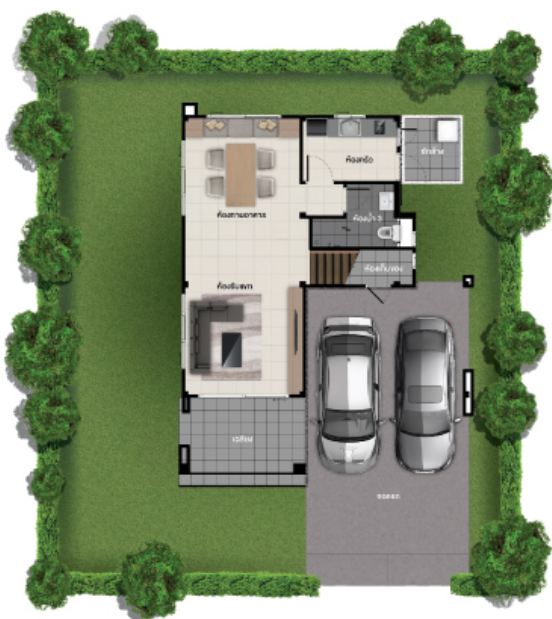
ชั้นล่าง

พื้นที่ใช้สอย 168 ตร.ม. 3 ห้องนอน 3 ห้องน้ำ 2 ที่จอดรถ