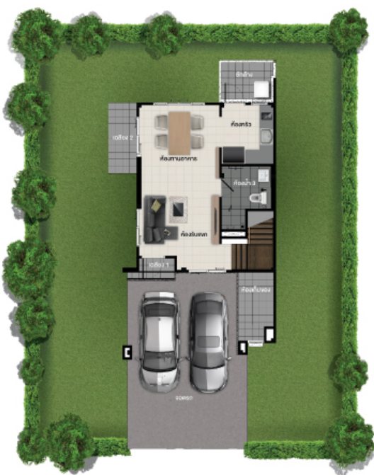
ชั้นล่าง

พื้นที่ใช้สอย 140 ตร.ม. 3 ห้องนอน 3 ห้องน้ำ 2 ที่จอดรถ