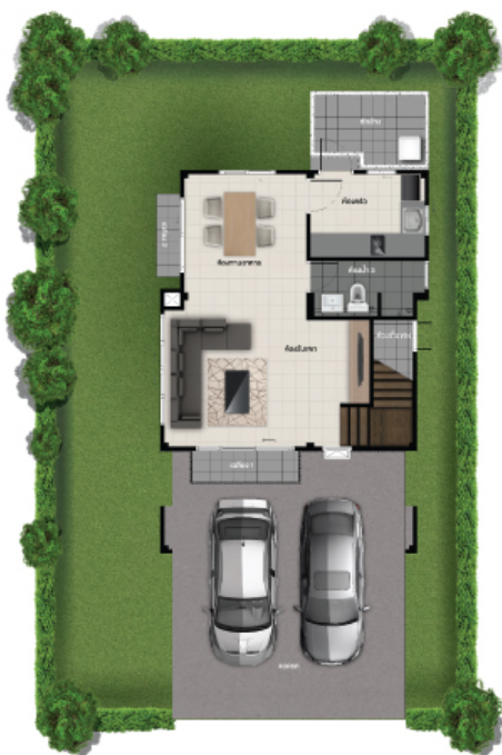
ชั้นล่าง

พื้นที่ใช้สอย 142 ตร.ม. 3 ห้องนอน 3 ห้องน้ำ 2 ที่จอดรถ