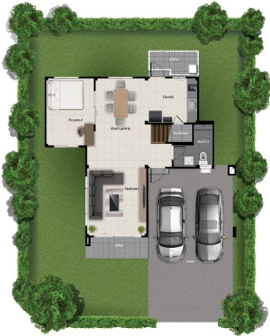
ชั้นล่าง

พื้นที่ใช้สอย 167 ตร.ม. 4 ห้องนอน 3 ห้องน้ำ 2 ที่จอดรถ