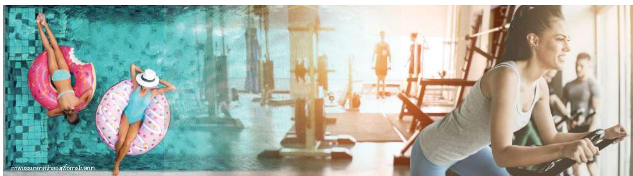
ภาพบรรยากาศห้องฟิตเนส