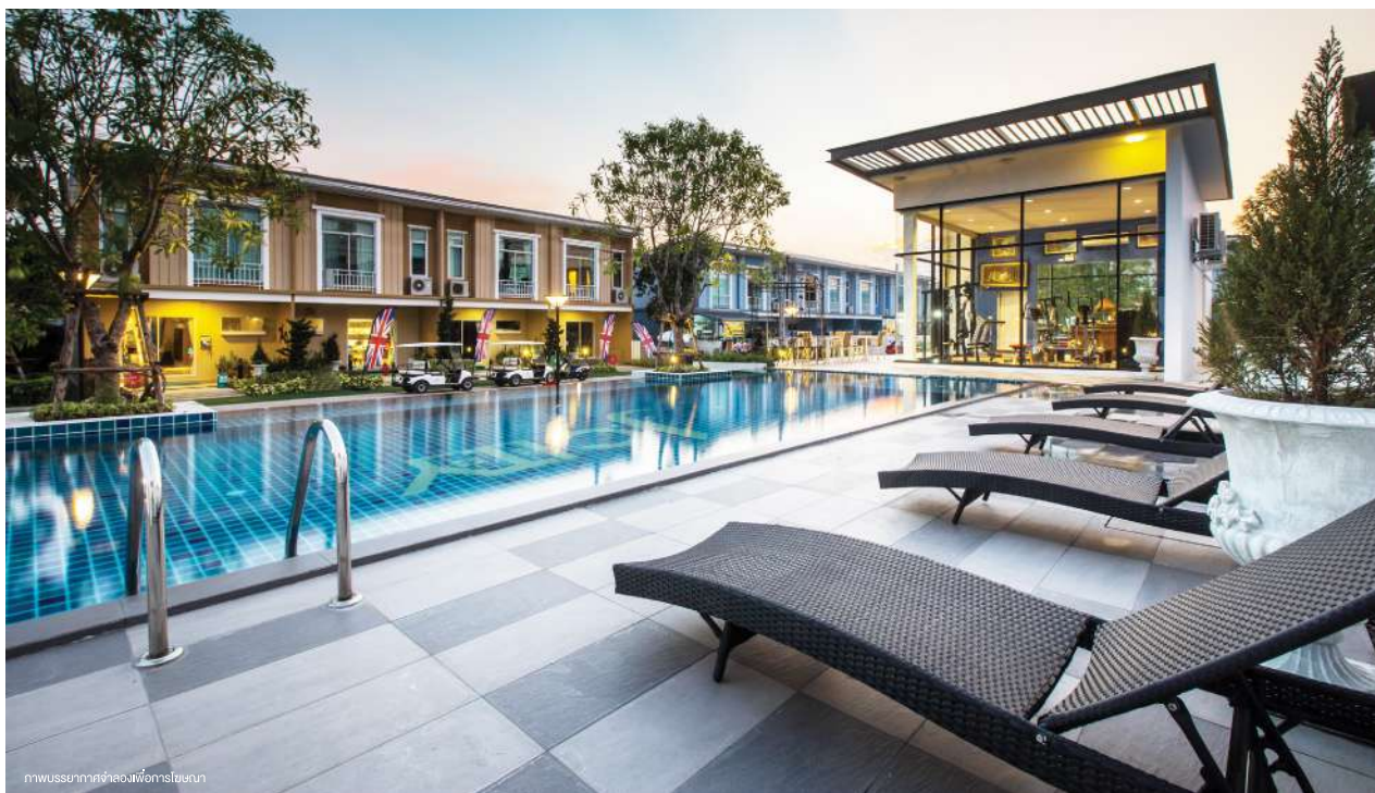
ภาพบรรยากาศห้องฟิตเนส

ให้คุณใช้ชีวิตเหนือระดับ กับสิ่งอำนวยความสะดวกครบครัน ท่ามกลางธรรมชาติ เพื่อคุณภาพชีวิตสมบูรณ์แบบ