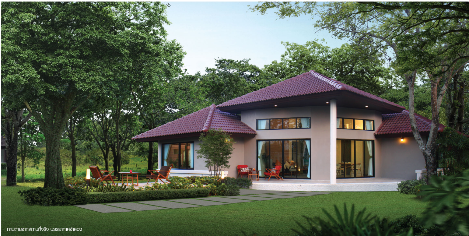
ภาพถ่ายจากสถานที่จริง บุษยามาศจำลอง