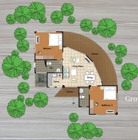
Ground Floor Plan

เพิ่มพื้นที่ขนาดใหญ่รอบบ้าน ราคาพิเศษ มีจำนวนจำกัด!!