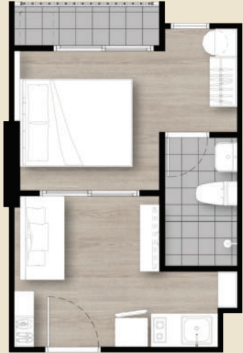
TYPE B2 24.00 SQ.M.