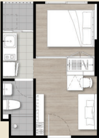
TYPE A 22.00-22.50 SQ.M.