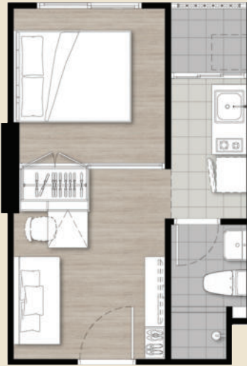
TYPE B1 24.00-24.50 SQ.M.