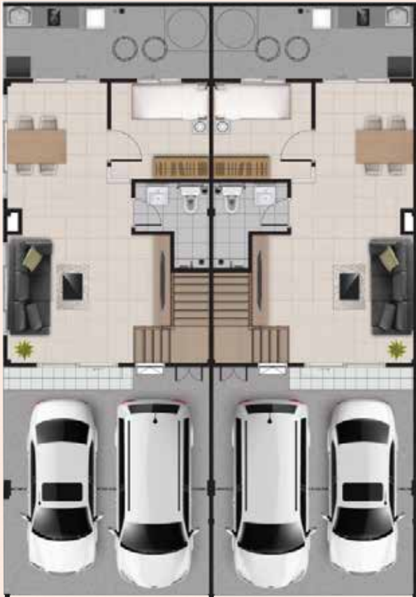
ชั้นล่าง

พื้นที่ใช้สอย 138 ตร.ม. เทียบเท่าบ้านเดี่ยว 4 ห้องนอน 2 ห้องน้ำ 2 ที่จอดรถ